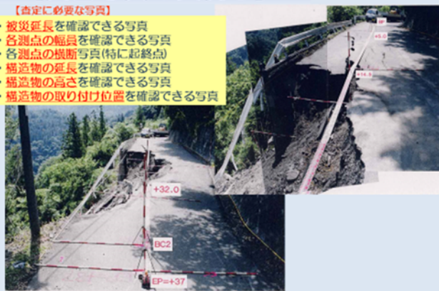
(林道施設災害復旧事業の資料より)